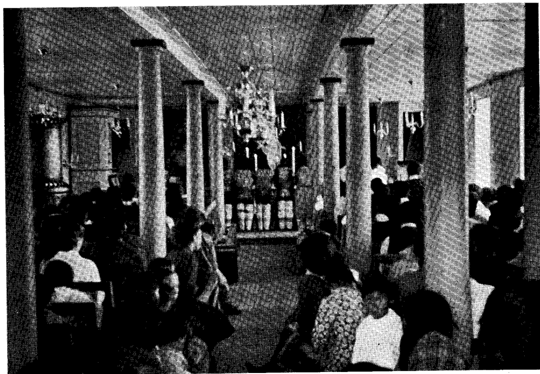
Fylde kirker er ikke noget særsyn i Grønland. Det er feststemningen såvel som sangen og prædikenen, der drager.

Der er flag oppe over kolonien fra morgenstunden af. Dannebrog vajer fra huse og fjeldtoppe, og hundreder af små flag pynter stuerne rundt i hjemmene; thi sommerens konfirmationsdag er en af de helt store festdage, ikke blot i Sukkertoppen, men alle steder i Grønland, også på de mindste bopladser. Mange måneder i forvejen har mor haft aftenen optaget med at sy festdragten til sønnens eller datterens første store festdag. Den grønlandske nationaldragt er vel nok en af de smukkeste i verden, men kun i Grønland kommer den rigtigt til sin ret, hvor dens farvepragt lever op mellem de grå og brune fjelde og sætter i dobbelt forstand kulør på tilværelsen.