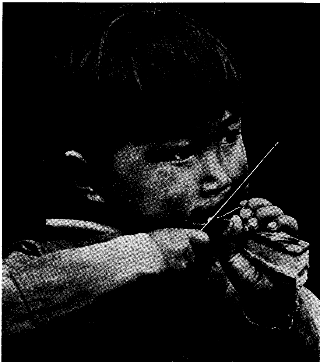
Hvalens hud kaldes i Grønland „mattak“ og har altid været grønlændernes mest yndede spise. Den er både nærende, vitaminrig og særdeles velsmagende

op ved Godhavn efter hollandsk mønster med håndharpun og bøjer, men med konebåde i stedet for slupper. Også Den kongelige grønlandske Handel blev nu interesseret i hvalfangsten i Davisstrædet og udrustede i 1774 eet skib og året efter fem skibe. Fangsten blev een hval pr. skib, nok til at man anlagde hvalstationer forskellige steder, blandt andet ved Godhavn og Fortuna Bay. 1804 steg fangsten til 20 hvaler, men derefter gik det