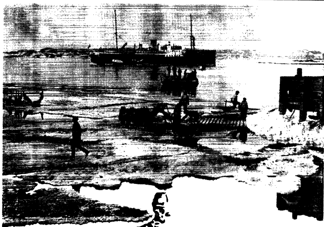
m.s. „Dronning Alexandrine“ ved Kolonien „Egedesminde“ i Grønland