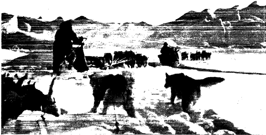
Fiskeri ved Jakobshavn kræver, at hver enkelt fisker har et stærkt og velfodret hundespand, for vejen til fiskepladsen er lang og streng. Her ses grønlandske fiskere på vej over isfjorden til fiskepladsen.