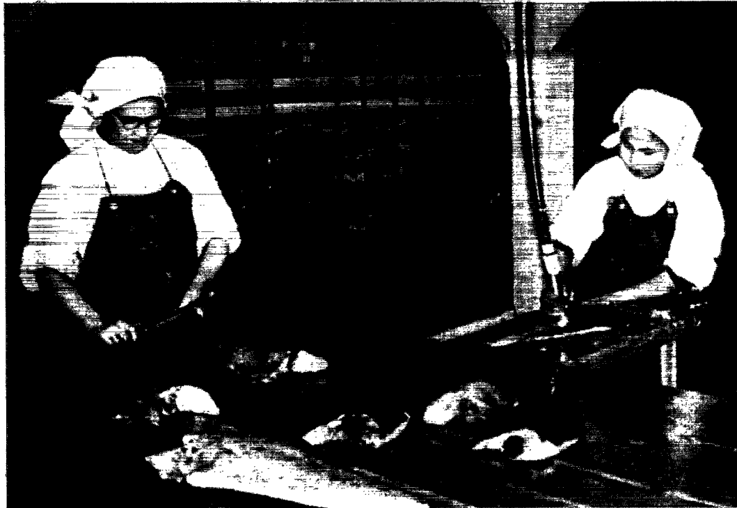
Hellefisken renses og tildannes, et arbejde for hvilket grønlanderinderne har stort håndlag.