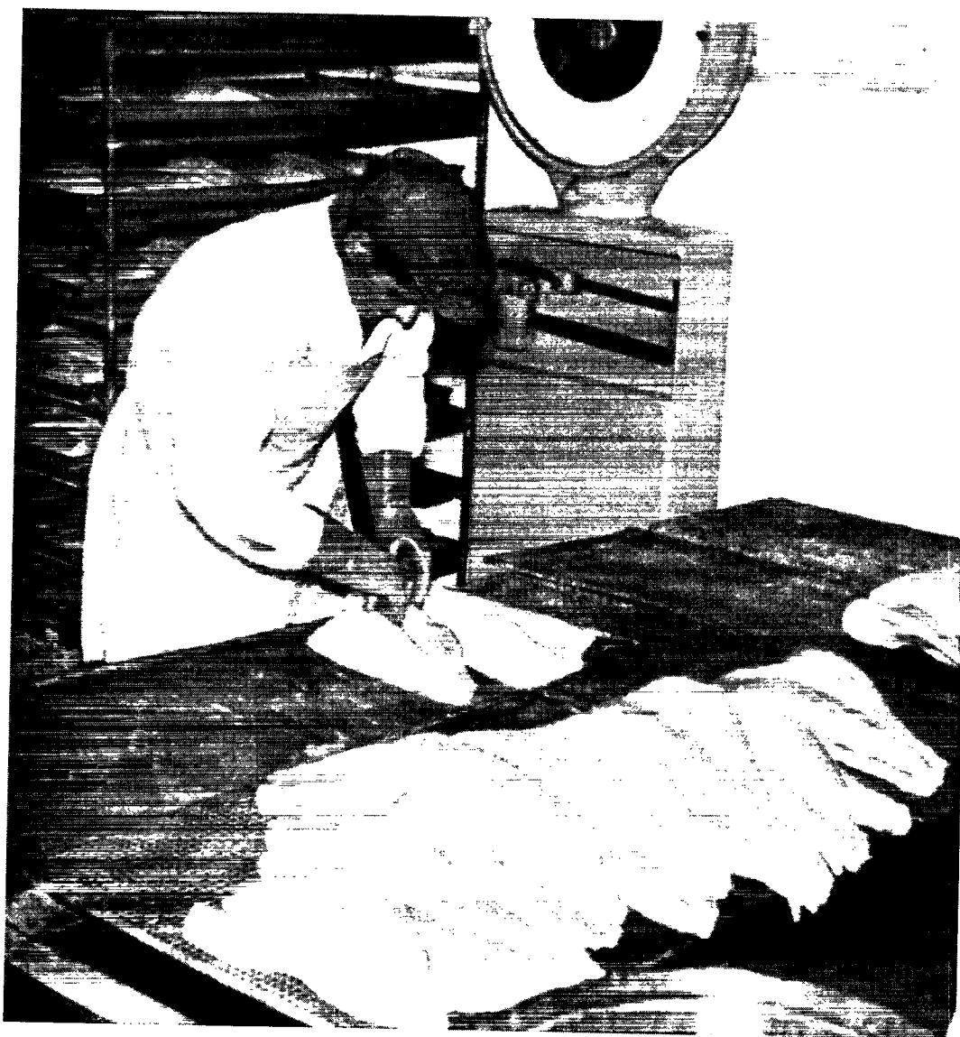
Hellefisken gennemgår mange processer. Her bliver de færdige fileter sorteret og vejret omhyggeligt. Billedet er fra Christianshåb.