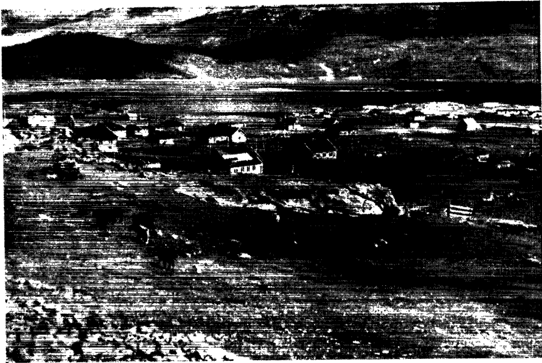
Skoleradioen vil utvivlsomt kunne skabe et fællesskab mellem skolebørn over hele Grønland. Børnene på udstederne vil i en række fag få samme undervisning som børnene i byerne. Billedet viser et kig ud over udstedet Igaliko.