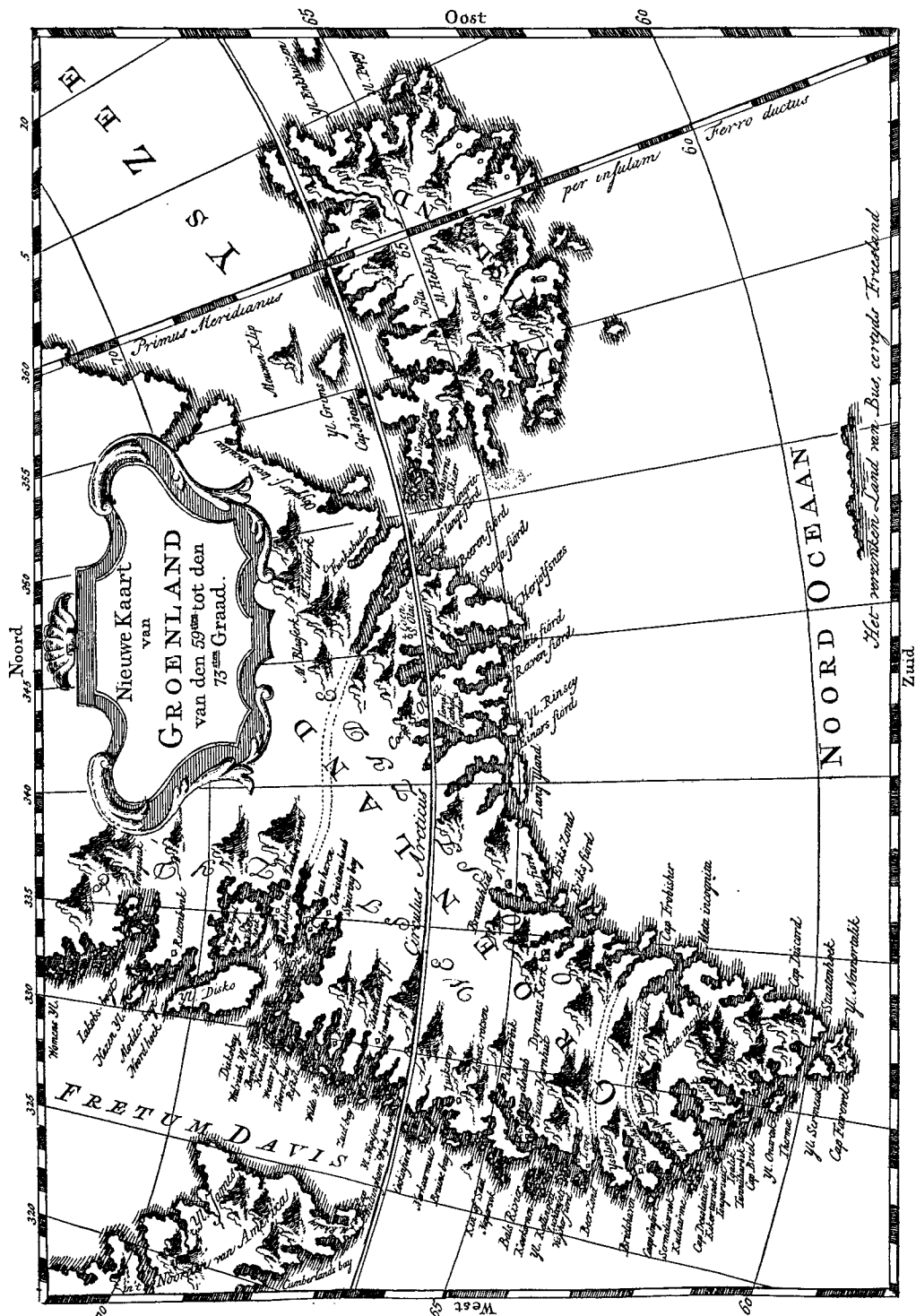
Kortet findes i Davis Cranz's: Historie van Groenland, (Amsterdam og Haarlem 1767). Bemærk Ejland Buss i kortets underkant.