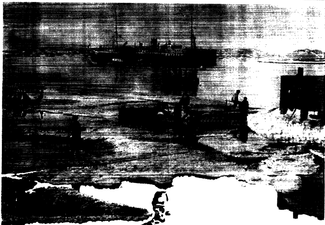
m.s. „Dronning Alexandrine“ ved Kolonien „Egedesminde“ i Grønland