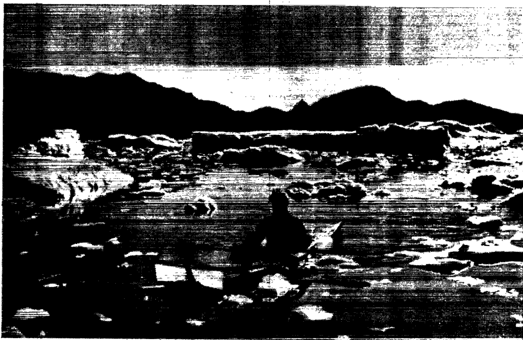
Kajakken - måske det eleganteste fartøj i verden - er ypperlig til sælfangst, men til torskefiskeri er den uegnet.

til dækning af driftsudgifterne. Indenskærs er der ikke fisk. Trods åbent vand og kun udsigt til storsis har resultaterne været deprimerende. Dertil så det forrygende dårlige vejr.