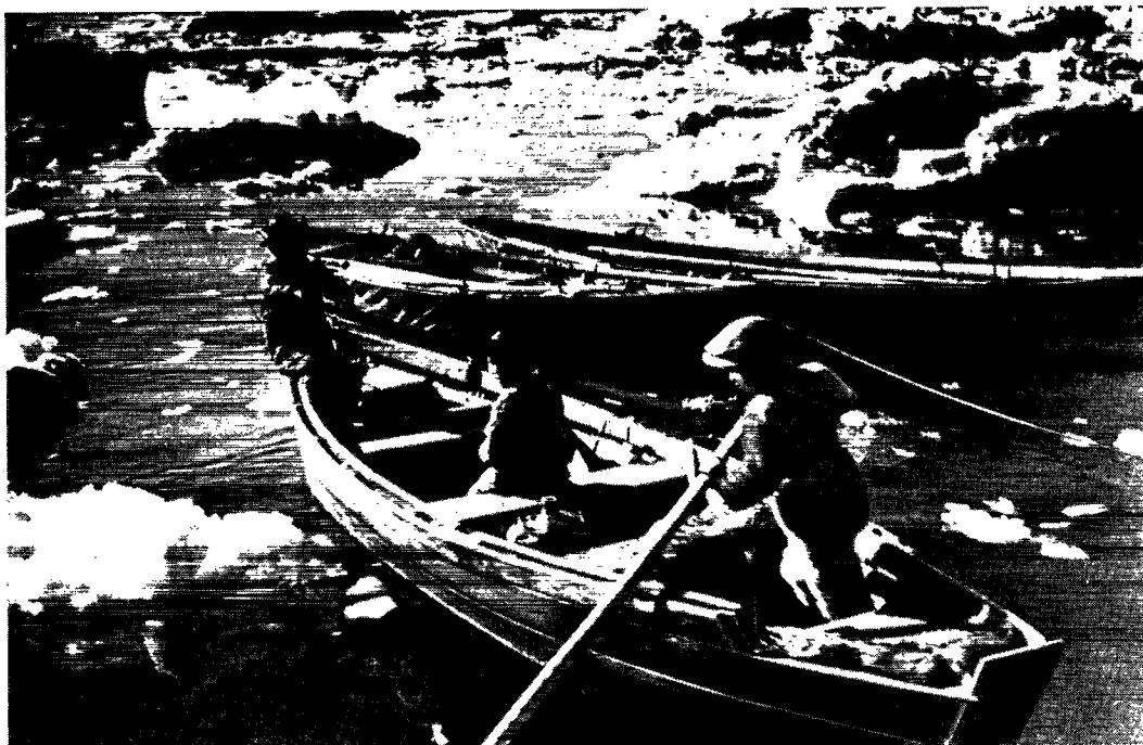
Robådene kan nok bruges til fjordfiskeri i stille vejr, men sigter man efter en fiskeindustri, er de utilstrækkelige.

mandsbrug. Er det overraskende, når 25 % af fisken her for blot et par år siden blev fisket og bragt ind med kajak? Men kan en sådan produktion bære det vel-færdssamfund, vi er begyndt at opbygge? Hvordan skal det gå med millioninvesteringerne, dersom der ikke også investeres, så det bliver muligt både for fiskere og fiskeriarbejdere at være beskæftiget året rundt? Og når der nu beviseligt er mulighed derfor?