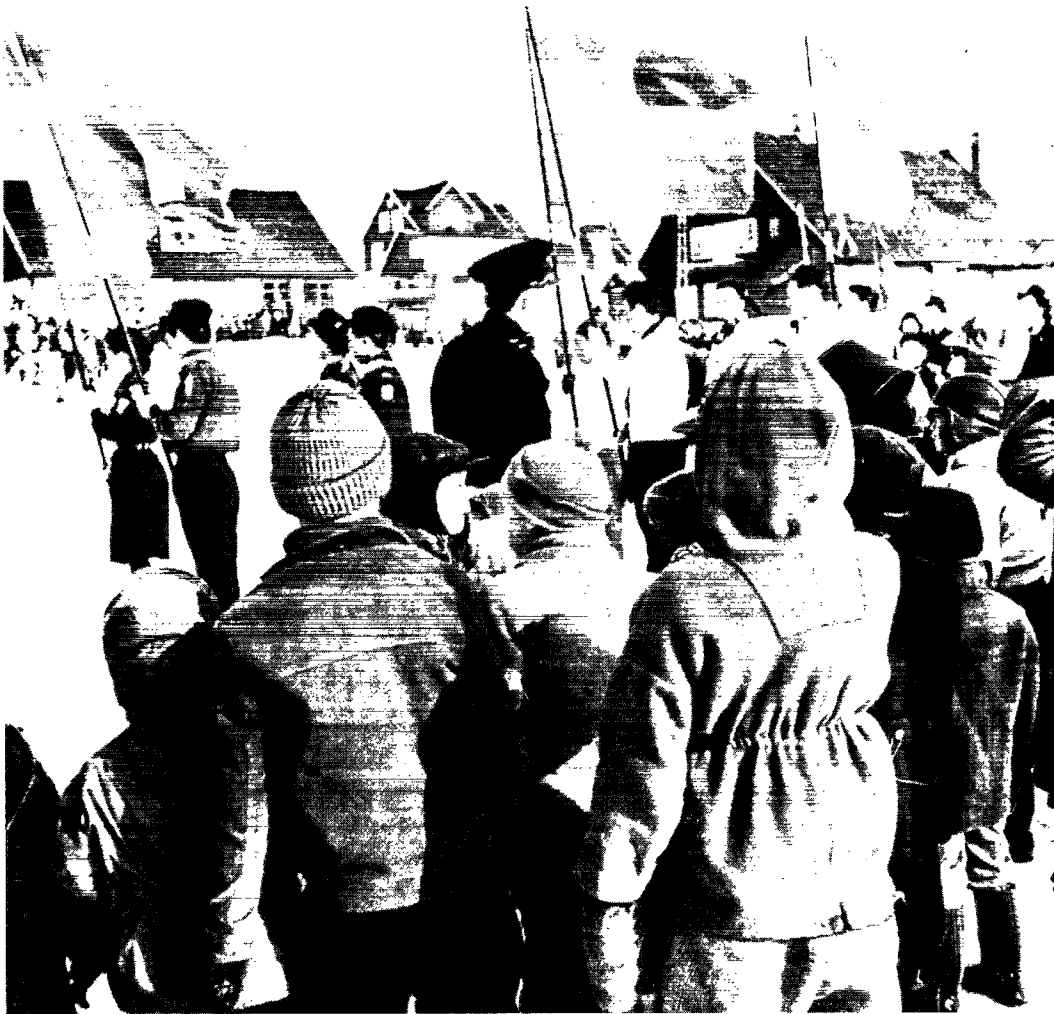
I Julianehåb fejrede man kongens fødselsdag med en spejderparade på torvet, hvor politiet sørgede for den fornødne afspærring.