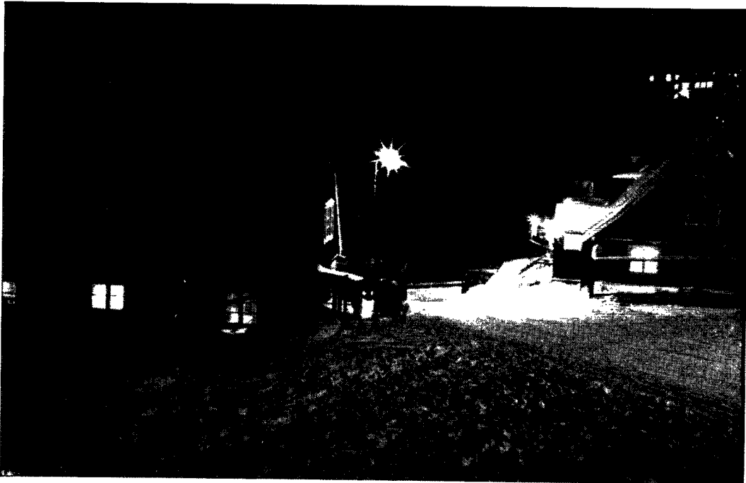
Vinteraften i Jakobshavn.