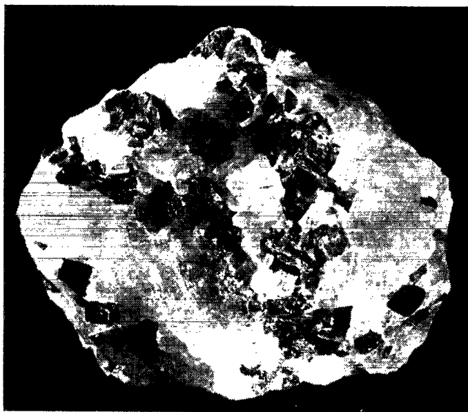
RÅKRYOLIT FRA IVIGTUT