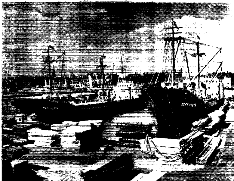
M/S «MARY NORTH» og M/S «ELFY NORTH» ved kaj i København