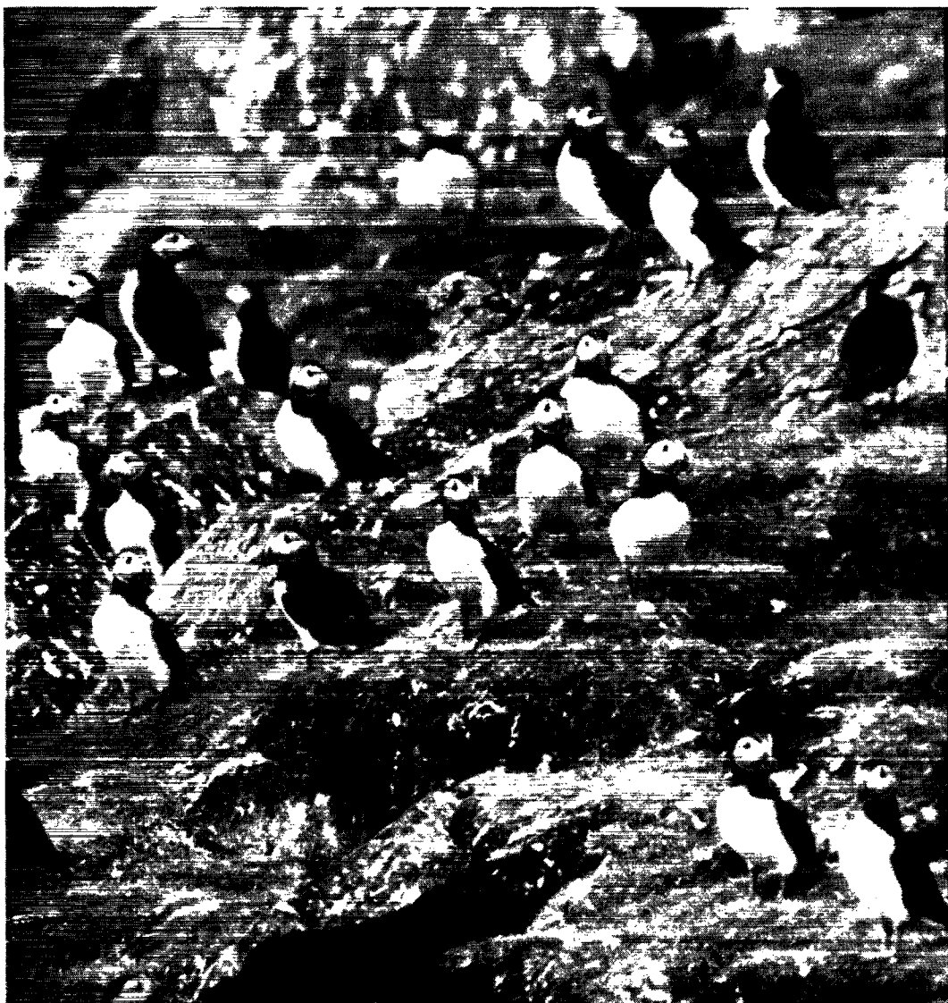
I de store lundelände på Færøerne kan jorden være helt undermineret af fuglenes rede gange. I Grønland yngler lunden spredt og fåtalligt.