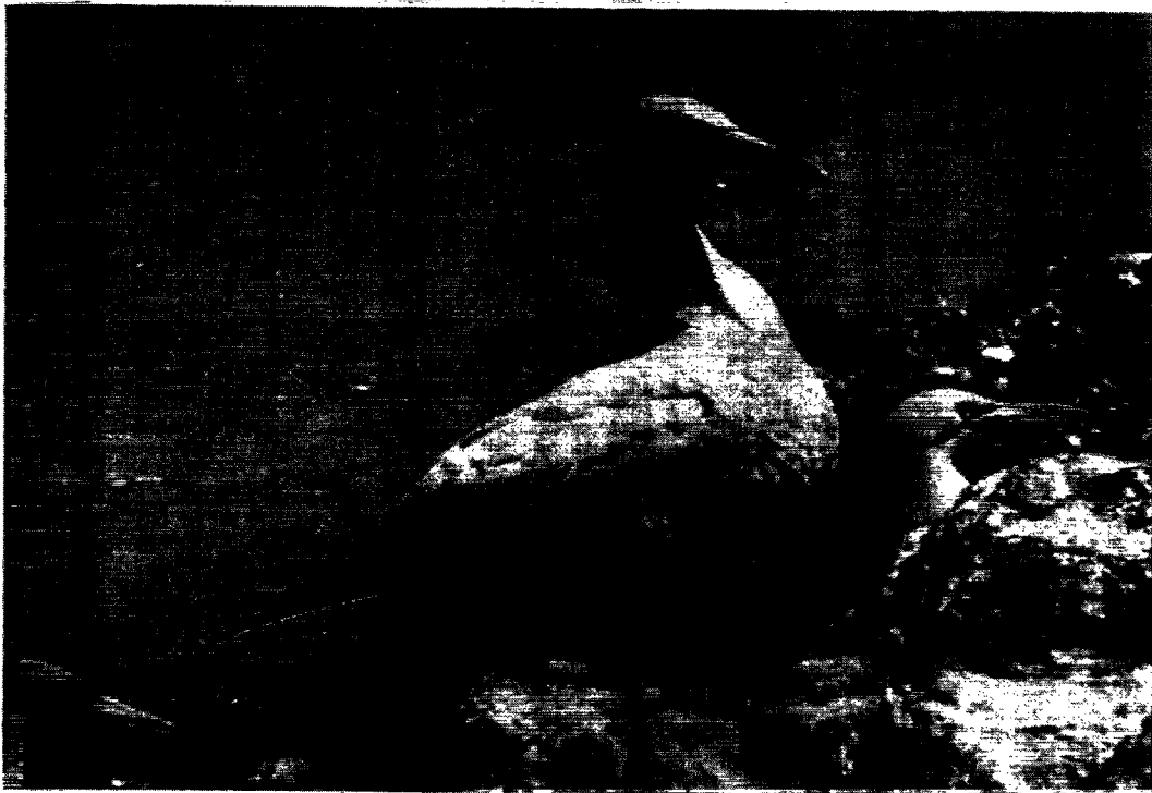
Den rugende sule.