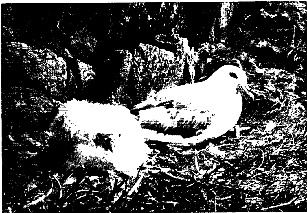
Malleukken med sin ene unge, som på Færøerne fanges i store mængder.