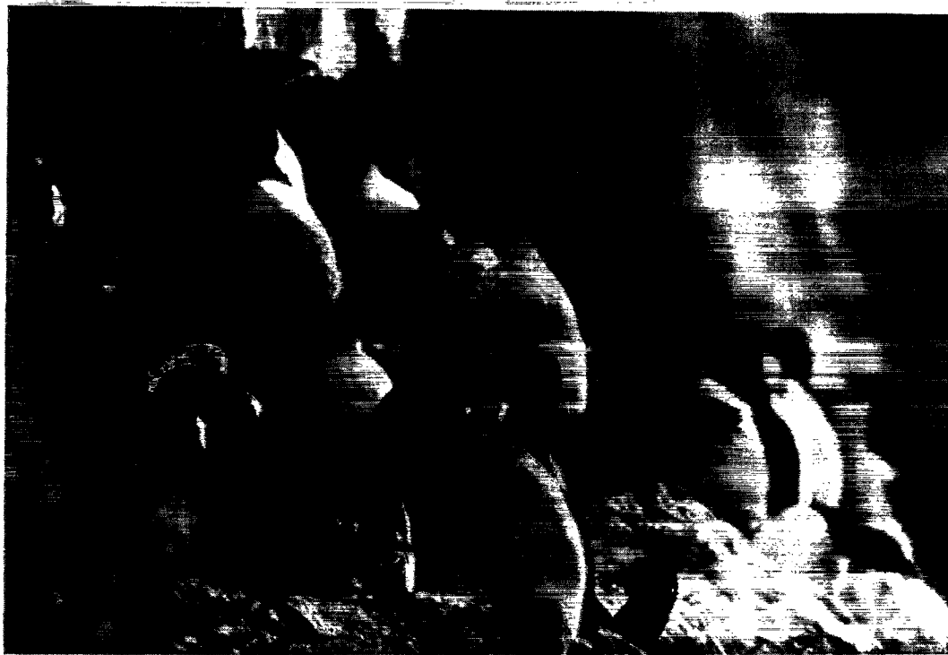
De rugende fugle sidder tæt sammen på klippehylderne.