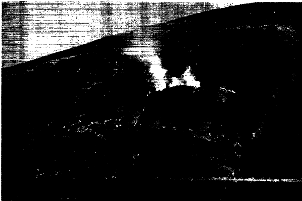
Fig. 4. Pujortoq 1958. Nyt skred har sat skifrene i brand. Skredet fra 1932 markeres af den nederste terrasse. 8. juli 1958.

under skredet eller som følge af et indhold af svovlkis var brudt i brand. Ved branden ændres skifrenes oprindelige sorte eller grå farve til en kraftig teglstensrød. Brandstedet kaldes af grønlænderne Pujortoq (røgstedet), og det er karakteristisk for fænomenet, at man kun ser røg, ingen flammer. I nærheden af Pujortoq findes et sted, hvor skifrene er rødbrændte, og hvor det siges, at der i 90'erne er foregået et skred med efterfølgende brand. Stedet kaldes Amiutikavsaq (det misfarvede). Ny brand udbrød i 1958 ved Pujortoq i forbindelse med et nyt skred (fig. 4), og i 1963 foregik der øst for Niaqornat ved Narsârssúnguaq et meget betydeligt skred, som satte skifre i brand og ændrede deres farve. Rødbrændte skifre ved Saviarqat nær Serfat er vidnesbyrd om fortidige brande som følge af skiferskred, men tidspunktet er mig ikke bekendt. Også inde i land er der på Nûgssuaq foregået skred med lignende resultat (kortet fig. 12, pag. 360 i november heftet). Vi vender os nu til Nûgssuaq's sydkyst mod Vaigat, hvor vi finder lange strækninger ved Atâ og Pautût, hvor fjeldsiderne lyser i de skønneste, røde farver. Det drejer sig også her om rødbrændte skifre, som indgår i vældige skredkulisser, og det kan godtgøres, at de røde skifre oprindelig var sorte ganske som ved Niaqornat, og at farveskiftet ligesom der må stå i