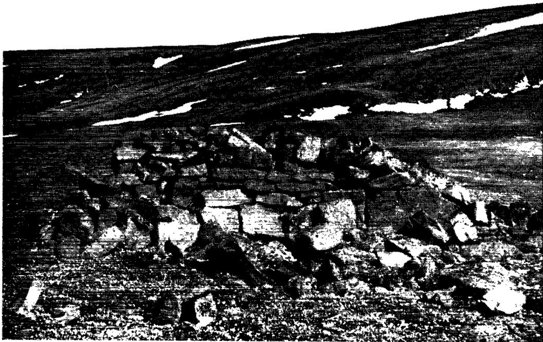
Fig. 1. »Bjørnefælden« nord for udstedet Nûgssuaq set fra vest. A. Rosenkrantz fot. 12. juli 1950. Ruinen blev udgravet af Nationalmuseet 1953.

af de gamle sagaberetninger at fremgå, at det efter kristendommens indførelse var blevet en uskik at begrave folk i uviet jord, men der kendes dog prominente undtagelser.