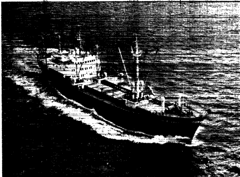
M/S «GRØNLAND» i rum sø