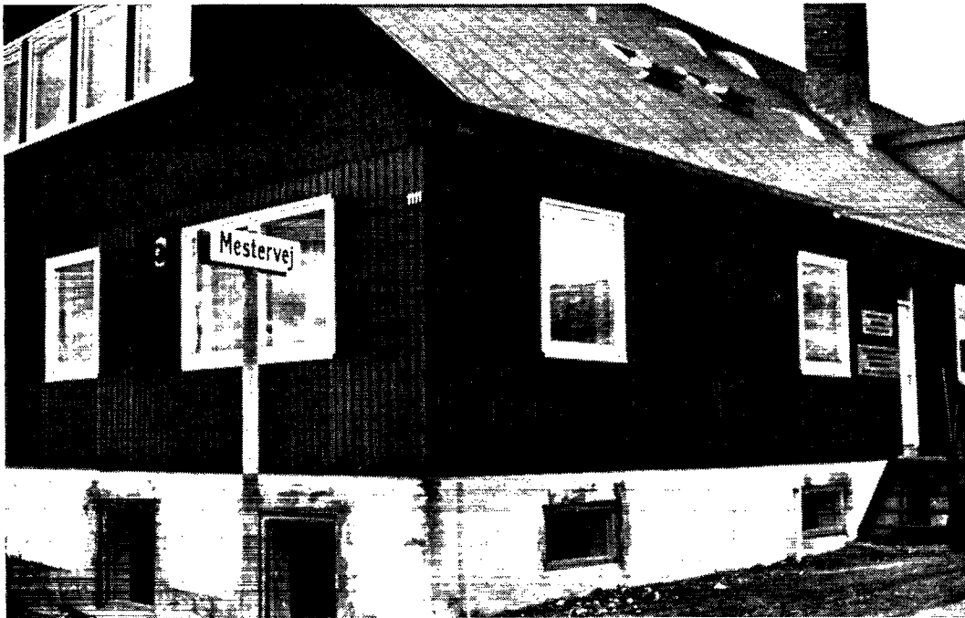
Landsrådets kontorer i Godthåb.

sige deres eget barn. Det bør man have et svar på under forårsmødet i Grønlands Landsråd, for ingen, hverken i den danske eller den grønlandske befolkning, er tjent med usikkerhed og tågetale på dette punkt.