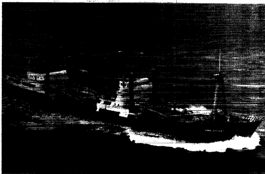
M/S «ANNA JOHANNE»

A/S DET DANSK-FRANSKE DAMPSKIBSSELSKAB København