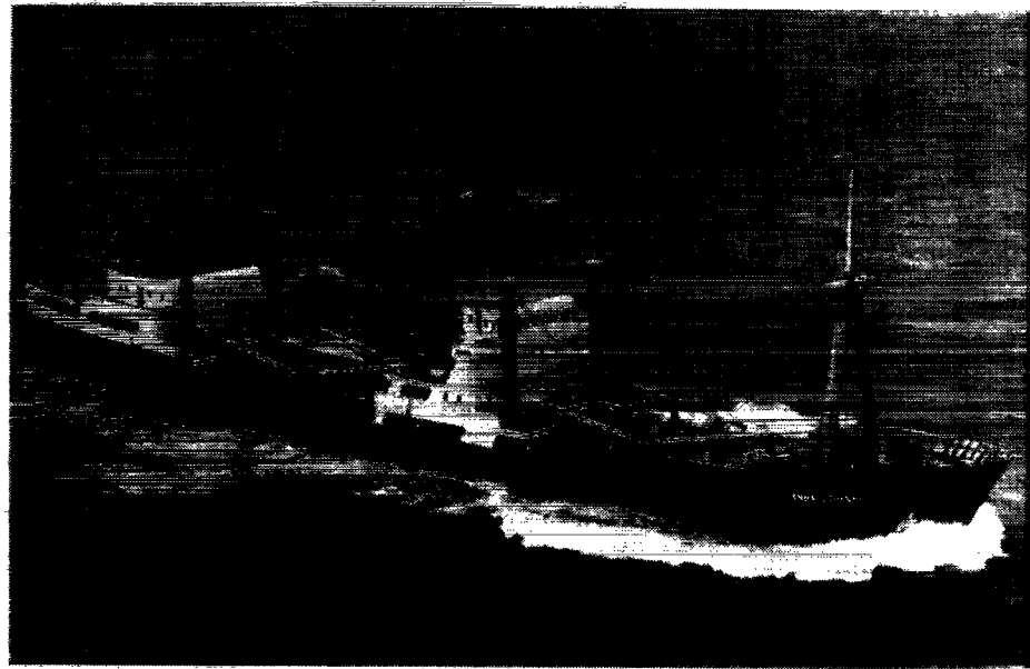
M/S «ANNA JOHANNÉ»

A/S DET DANSK-FRANSKE DAMPSKIBSSELSKAB København