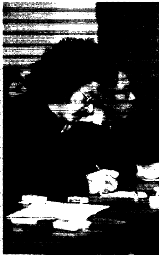
Fra den grønlandske delegation.