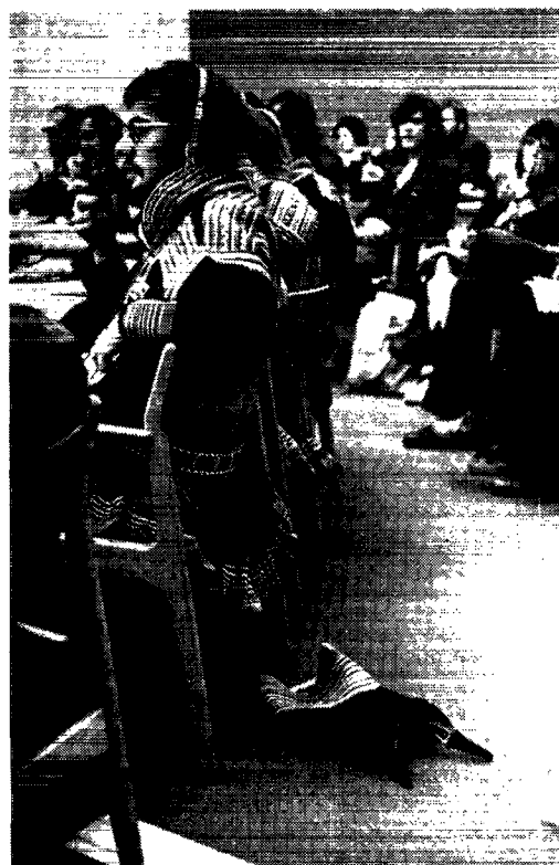
Fra den samiske delegation.

„– Hvad angår de såkaldt folkevalgte grønlandere i alle politiske instanser, må