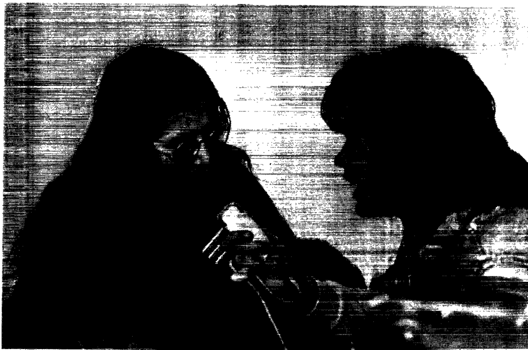
Interview med en af de indianske deltagere.