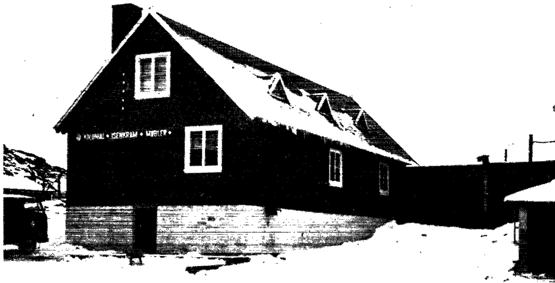
KGH's butik i Frederikshåb, der i februar 1973 blev lejet af Brugsen Pamiut. Pâmiune KGH-p niuvertarfiutâ fiþruârime 1973 brugsen Pâmiut-mit ártortonekartok.

nunâne Pigingnekatiġt Kátuvfiat“ autdlarnernekarpok. isumakatiġssutiginekarpok kátuvfik brugsforeningináungit-sunútaok angmassariakartok, taimalivdlune kalâtdlit pigingnekatiġfînút tamanút sâġfigssaussariakardlune.