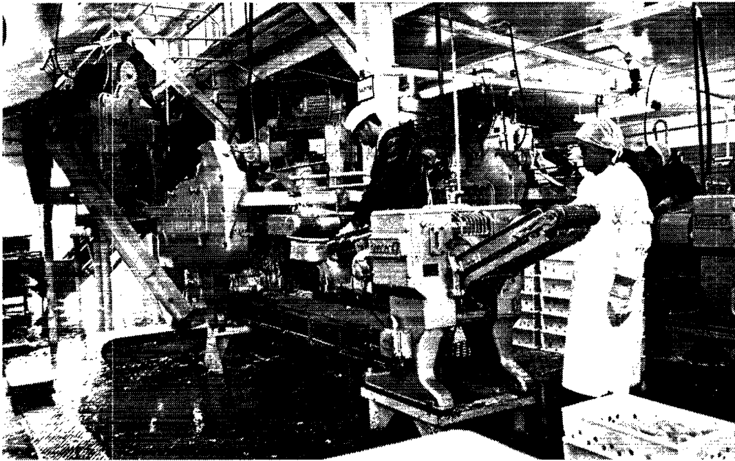
Filetsfabrikken i Sukkertoppen.