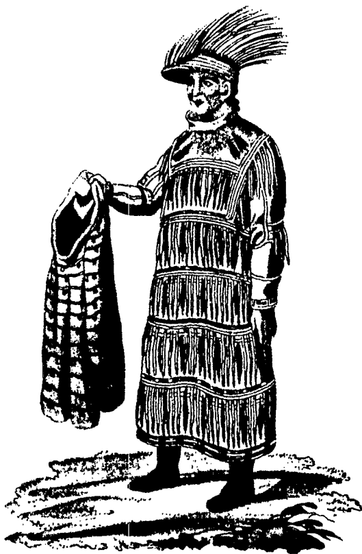
Mand i festdragt fra Unalaska. »Rejse i det nordøstlige Sibirien og på øerne i det nordøstlige Ocean«, af Gavriil Sarytjev.

ning af harpunspidser ved hvalfangst, noget som også kendes fra Kurilerne og Hokkaido. Så er der de klimændringer, vi har kendskab til i det pågældende tidsrum. Der er påvist en klimaforværring mellem 700 og 200 f.v.t. Efter denne tid ville lange rejser til fastlandet, måske tilskyndet af overbefolkning og østfra kommende konflikter, muliggøre forekomsten af handels- og fangsttogter, såvel mod nord som mod syd. Under sådanne togter kunne aleuterne hjembringe kulturelle impulser fra de japaniske øer, som så siden kunne påvirke den neo-eskimoiske opblomstren nordpå,