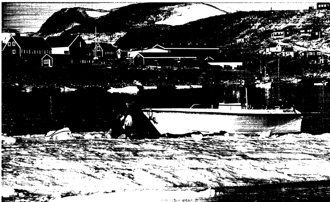
En af de nye Q-17 joller, som fuldtidsfangerne nu kan erhverve sig på rimelige vilkår. August 2000.

ejes af en pensioneret fanger på ældre-kollektivet (feltnotat 1999).