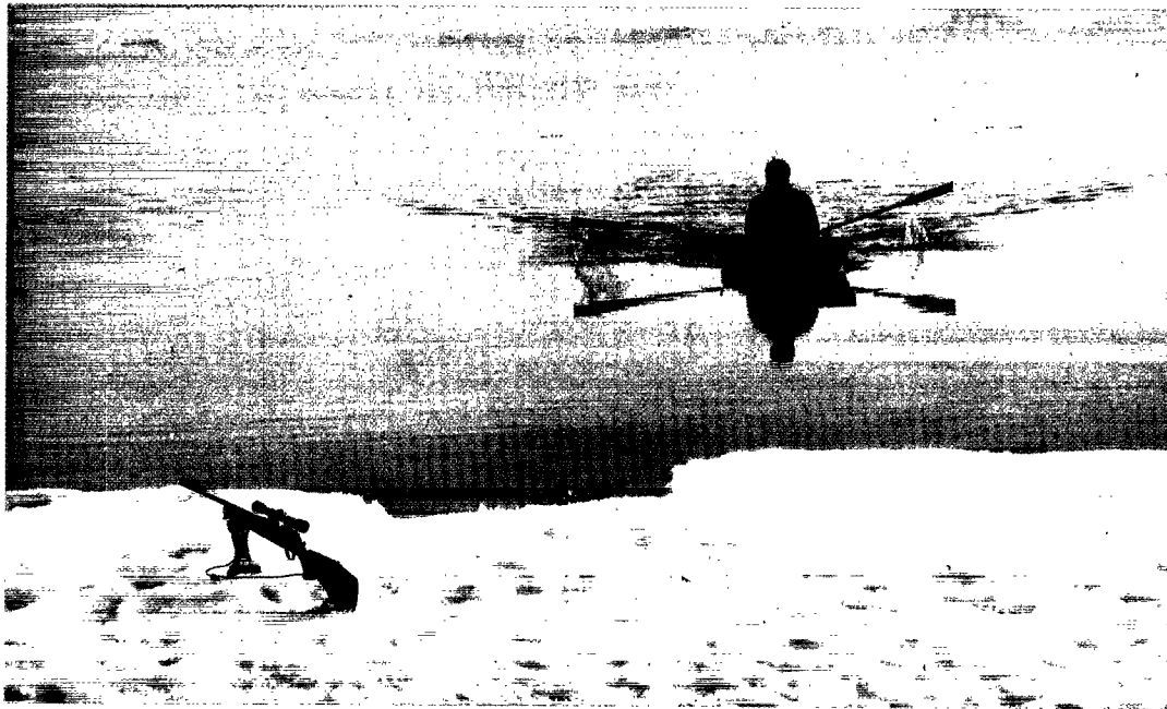
Iskantjollen i brug under sælfangst langs iskanten i munden af Scoresby Sund. Juni 1994.

perioden nu dække et langt større område og ved flagefangst sikre sig et større udbytte, end det havde været muligt ved den traditionelle kajakfangst. Da man tilmed om vinteren til iskantfangsten havde et bedre fartøj i iskantjollen, havde kajakken i realitetens omsider udspillet sin rolle. Den sidste kajak forsvandt i 1976 og i dag er motorjollen og iskantjollen de eneste fartøjer, der anvendes til fangst i distriktet. (Indenfor de seneste år er der kommet et par glasfiberkajakker til Scoresbysund, men de bliver udelukkende brugt til rekreative formål og i forbindelse med guidede turrister og benyttes ikke til fangst).