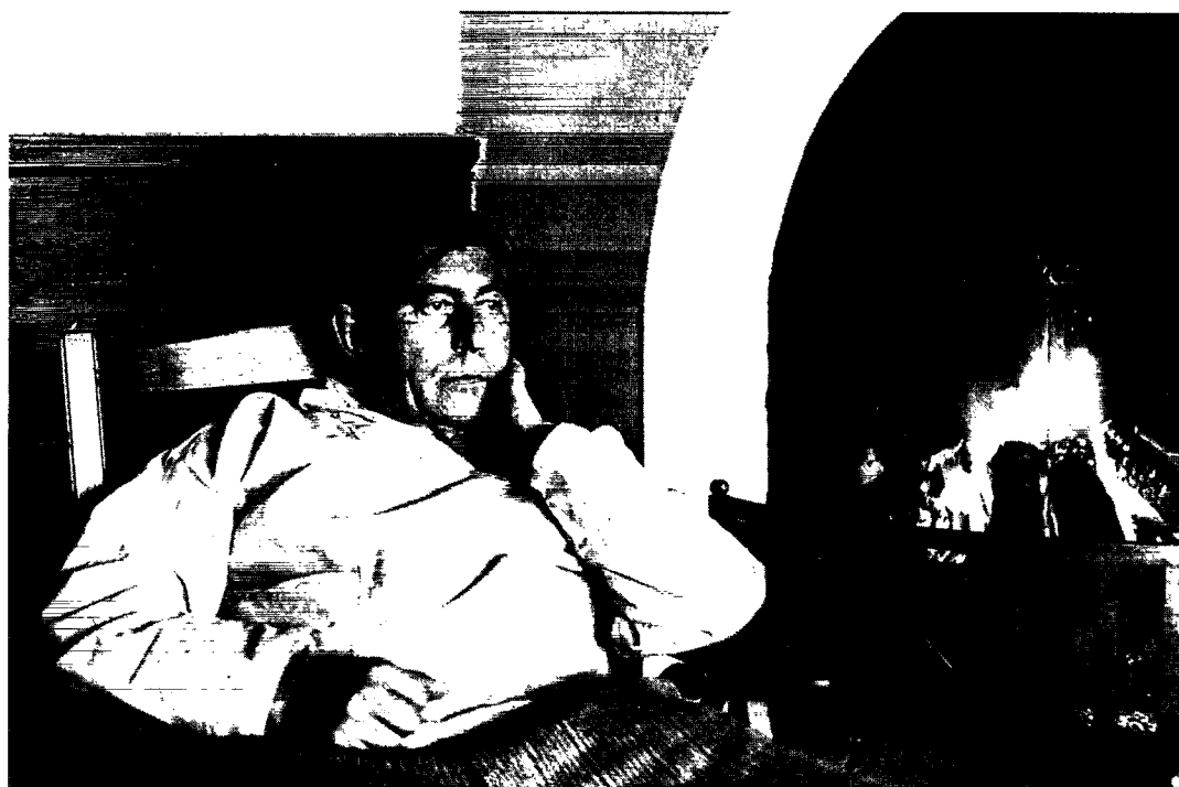
Knud Rasmussen ved pejsen i Hundested 1932.

har jeg gennem mine studier faaet det stærkeste indtryk av, at der ogsaa iblandt saadanne folk træffes en højtstaaende og beundringsværdig »litteratur«. Denne er hos disse folk aldrig optegnet av dem selv i skrift, men eksisterer i levende tradition, hvad der ikke kan forringe denne litteraturs kunstneriske værdi. Jeg vilde give eskimoernes sagn og poesi prisen. [...]